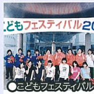
●こどもフェスティバル