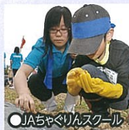
●JAちやぐりんスクール