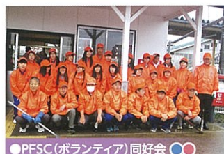
●PFSC(ボランティア)同好会 ○○