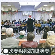
●吹奏楽部訪問演奏