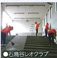
●石鳥谷レオクラブ